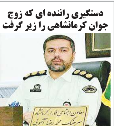
دستگیری راننده ای که زوج جوان کرمانشاهی را زیر گرفت